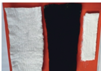
Исходный шпинели после шпинель материал

Цель настоящей работы – исследовать процесс формирования наноструктурной шпинели методом теплат. Качество прекурсора использовался природный переработанный полимер – гидратированная целлюлоза в форме пористого нетканого материала. Этот полисахарид обладает сложным строением, включающим чередующиеся участки аморфной и кристаллической структуры гигантской молекулы, а также микро-, мезо-, и макропоры и каналы. Целлюлозный нетканый материал насыщался водным раствором солей алюминия и магния в различных заданных соотношениях. Затем насыщенная солями целлюлозный прекурсор термообработывали по специальному режиму до 1300°C с интервалом 100°C. Были исследованы эволюционные процессы хлоридов магния и алюминия, до наночастиц оксидов металлов, их взаимодействие с образованием шпинели и ее твердых растворов, изменения кристаллической и наноструктуры продуктов реакции, рост кристаллитов в процесс термообработки соледержащего целлюлозного прекурсора.